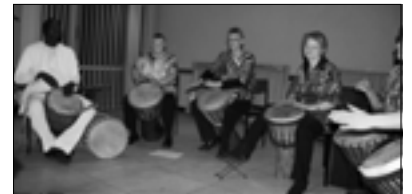
Die Trommelgruppe Gambia Jolo

Alle Teilnehmer des Konzertes traten wie immer ohne Gage auf. Gependet wurden die Blumen von der Blumenscheune