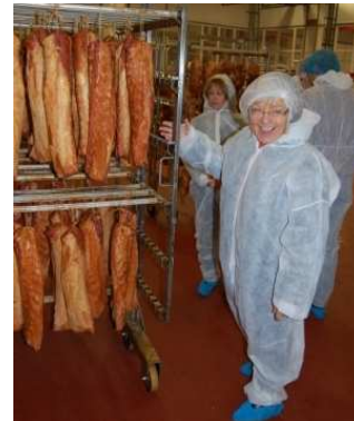
Ungewöhnliche Arbeitskleidung für Politiker? Beim Besuch des Fleischwerks galt es die Hygienevorschriften einzuhalten