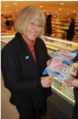
Politik mit dem Einkaufskorb: Beim Kauf auf nachhaltige Fischerei setzen.

Als letzte Station in Mecklenburg-Vorpommern stand nachmittags ein Besuch des Edeka-Centers Schlickeisen in Rostock an. Hier konnten meine Mitarbeiter und ich uns über das Fischangebot der Lebensmittelkette informieren. Als fischereipolitische Koordinatorin meiner Fraktion interessierten mich natürlich die ersten Erfahrungen des Konzerns mit der Umstellung auf Produkte der nachhaltigen Fischerei.