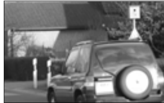
Der „Starenkasten“ am Garstedter Weg

die Vögel, da sich hinter der Attrappe ein veritabler Nistkasten im professionellen Geschwindigkeitsmessungsdesign verbirgt.