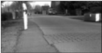
Seit Ende Februar fertig: der sanierte Randstreifen im Alten Kirchweg