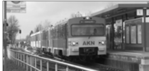
Wie lange fährt die AKN noch durch bis zum Hamburger Hauptbahnhof?

gische Konsequenz ist die Forderung nach einer ganztägigen (stündlichen) AKN-Verbindung ohne Umsteigevorgänge in die Hamburger Innenstadt. Dieses wäre aus ökologischer und öko-