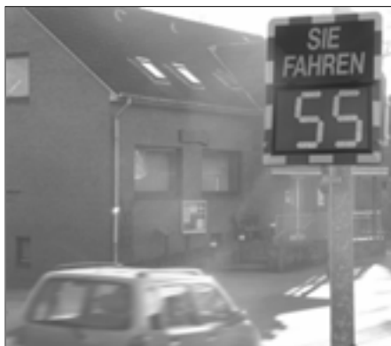
Die neue Geschwindigkeitstafel: Einsatz im Garstedter Weg

Die letzten beiden vorliegenden Auswertungen stammen aus