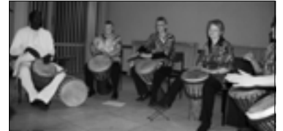
Die Trommelgruppe Gambia Jolo

Alle Teilnehmer des Konzertes traten wie immer ohne Gage auf. Gespendet wurden die Blumen von der Blumenscheune