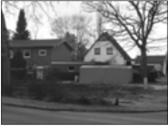
Hier stand noch bis vor kurzem die alte Kate.

Leider haben wir in Hasloh wieder eines der wenigen alten Häuser „verloren“. Aber die Bausubstanz der kleinen Kate an der Ecke Dorfstraße/ Alter Kirchweg war nicht mehr zu retten, so dass dem Eigentümer nach dem Auszug der Mieter