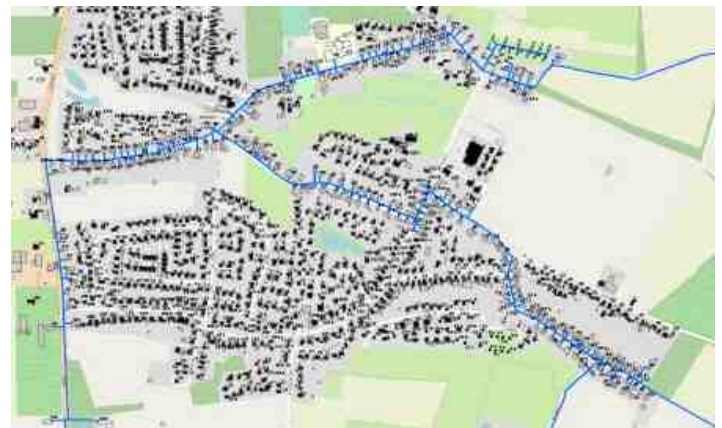
Trassenführung im Förderprojekt I

Im ersten Förderprojekt des Zweckverbandes Breitband konnten bereits fast 2.000 Kunden ans Glasfasernetz angeschlossen werden - leider noch nicht in Klein Nordende. Durch ein falsch eingezogenes Kabel kam es an der B431 zu Verzögerungen. Außerdem musste ein neuer Subunternehmer für den Tiefbau gefunden werden. Jetzt liegt ein neuer Zeitplan für den Tiefbau und die Kabelmontage vor. In Klein Nordende sollen die Arbeiten bis Mai 2022 abgeschlossen sein. Betroffen sind die Straßen B431, Am Redder, Schulstraße, Ziegeleiweg, Teile der Sandhöhe und Bürgermeister-Diercks-Str.: