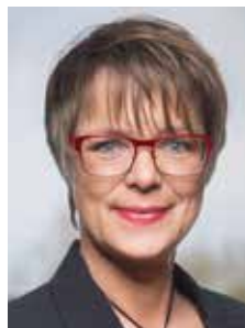
Kerstin Frings-Kippenberg Bürgermeisterin

dyempfang wollen wir fast alle haben. Während des Baus gab es dann auch noch Schwierigkeiten, weil ein Sattelschlepper mit Bauteilen nicht an einem Knick vorbeikam. Dieser sollte dann kurzerhand entfernt werden, aber eine Anwohnerin hatte aufgepasst und sofort das Amt Elmshorn Land, die Polizei und die Untere Naturschutzbehörde (UNB) des Kreises Pinneberg angerufen. Es gab ordentlich Wirbel und letztendlich hat die UNB entschieden, dass ein Stück des Knicks entfernt werden darf, nach Ende der Baumaßnahmen aber vom Verursacher ordnungsgemäß wieder neu angelegt werden muss.