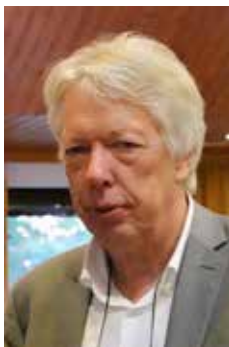
2019 im Gemeindezentrum