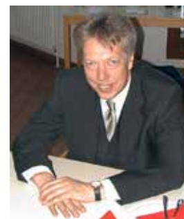
2000 im Gemeindezentrum

Für die Zukunft wünsche ich Dir alles Gute, bleibe weiterhin engagiert und vor allen Dingen gesund.“