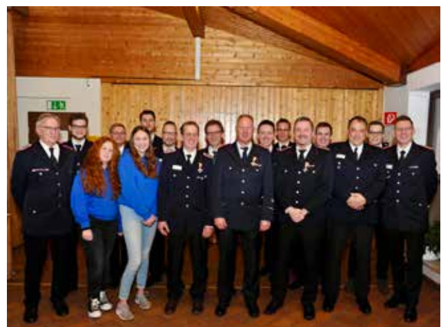
Die Gruppe der Geehrten