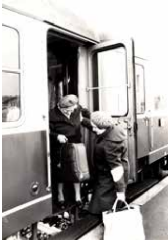
Eine Büchener Bahnhofsmissonarin hilft einer älteren Reisenden beim Aussteigen. Im Laufe ihres Bestehens wurden über 5 Mio. Gäste betreut, davon etwa 70 % Reisende aus der DDR.