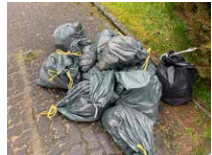
Das Ergebnis: 12 volle Müllsäcke – Dieser Müll befindet sich nicht mehr in der Natur

Das Wetter-Glück war auf der Seite der Fleißigen. Teilweise schien die Sonne und das Sammeln des Mülls in Gemeinschaft machte Freude. Nach 2 Stunden an der frischen Luft trafen sich alle um 12:00 Uhr beim Ortsvereinsvorsitzenden zu Hause auf ein paar heiße Würstchen und