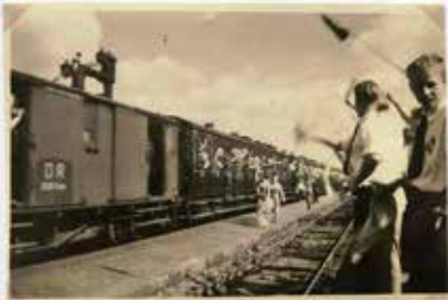
Das Hilfsengagement im Rahmen des evangelischen Kirchentags 1953, bei dem mehrere Tausend DDR-Bürger nach Hamburg einreisen durften, markierte den Anfang der konfessionellen Bahnhofshilfe in Büchen.