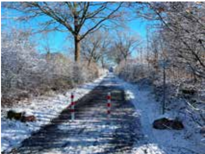
Sandkump mit Schneedecke – so sah es am 10.03. am Vormittag aus.

Am Freitag, den 09.03. sah es über Tag noch so aus, als wenn alles wie geplant ablaufen könnte. Als sich die Umweltausschuss-Mitglieder allerdings am Samstag, den 10.03.23 um 09:30 Uhr im Gemeindezentrum trafen, war die Entscheidung der Absage der Aktion schnell getroffen. Die nahezu in allen Bereichen geschlossene Schneedecke machte ein Finden des Mülls, der mit Sicherheit in der Landschaft vorhanden war, nahezu unmöglich.