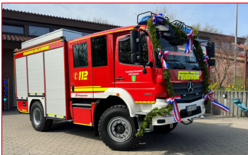
Das neue LF 10 der Freiwilligen Feuerwehr Köln-Reisiek!