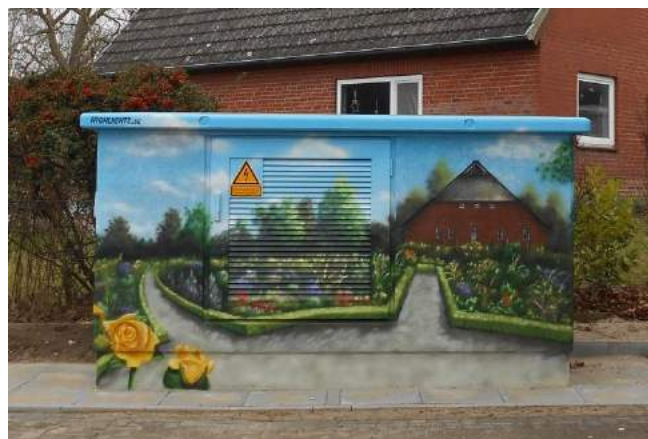
Foto: So schön können Verteilerkästen gestaltet werden, hier in Nessendorf an der Bungsbergstraße.